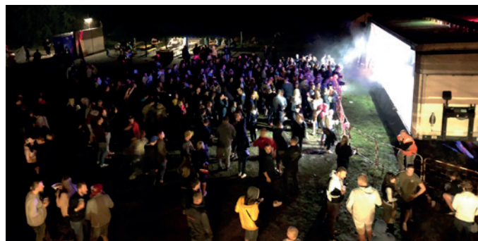
Za SDH Jan Seneta