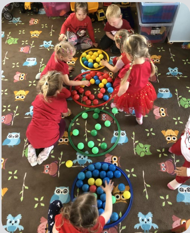
Barevný týden - oblékáme se do barvy toho konkrétního dne a máme aktivity zaměřené na poznávání barev (malé děti třídí míčky).