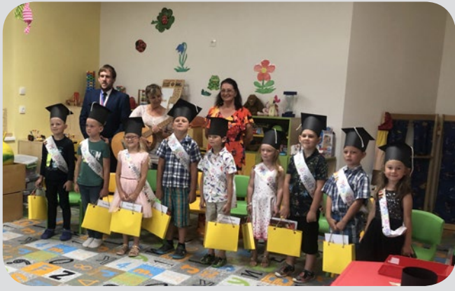
Slavnostního šerpování školáků - dětí, které od nás odcházejí do základní školy. Koná se dopoledne poslední den školního roku za účasti pana starosty a rodičů odcházejících dětí.