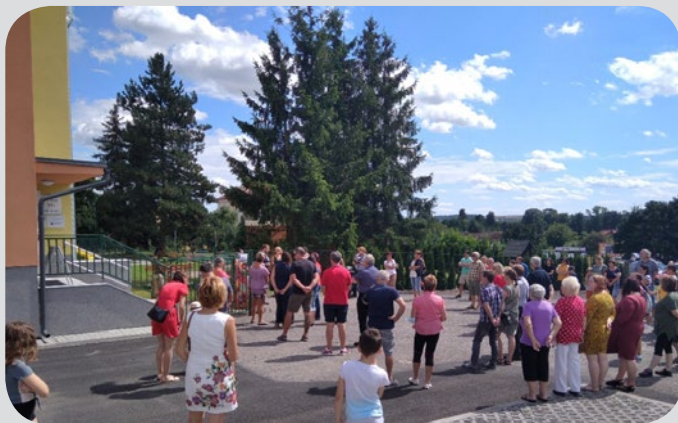
Den obce - sobota 7. srpna, 14 hodin. Díky pěknému počasí i možnosti dostat se po delší době na společné setkání, se před MŠ sešlo mnoho lidí. Rádi jsme jim ukázali, jakou proměnou naše školka prošla.