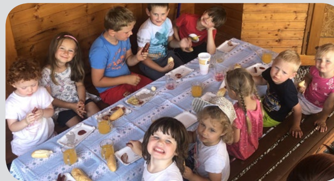
Poslední den - pěkná fotka z oběda.