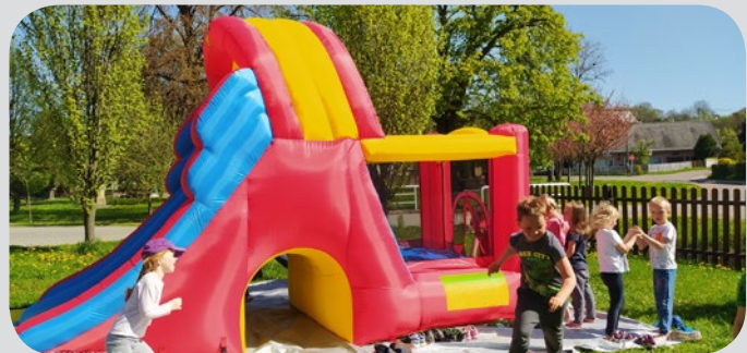
Nafukovací hrad - zde ve středu obce na hřišti před obecním úřadem.