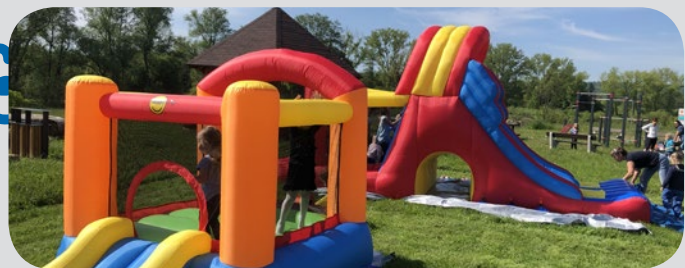
Den dětí - nafukovací hrad na hřišti za bývalou poštou.