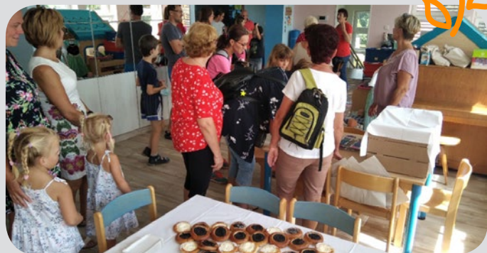
Den obce - občerstvení v horní třídě.