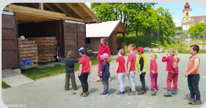
Školní olympiáda - lukostřelba na sportovním areálu za bývalou poštou.