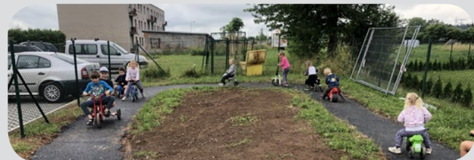
Nové dopravní hřiště - tráva už narostla, čekáme ještě na dopravní značení, ale už se jezdí a je to paráda!