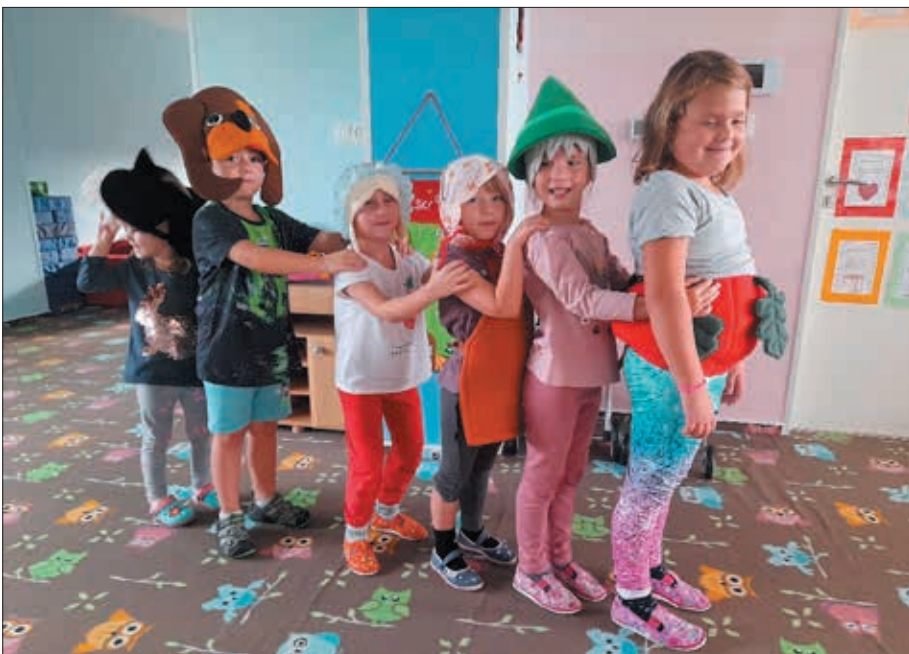
Pohádka O veliké řepě