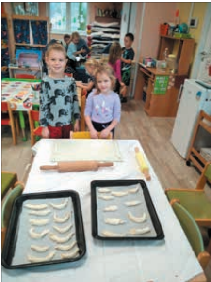
Pečeme rohlíčky na Sv. Martina