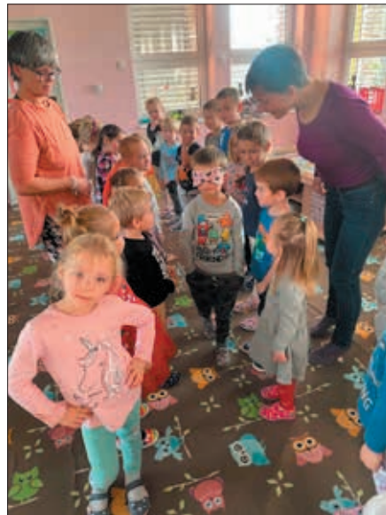
Záchranná stanice Jaro Jaroměř