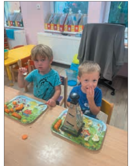
Příprava vitamínového salátu