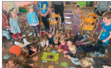
Záchranná stanice Netopýr