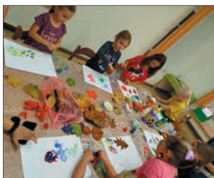
Začínají tvořící čtvrtky