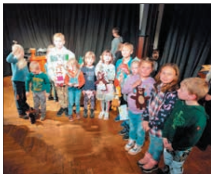
V loutkovém divadle