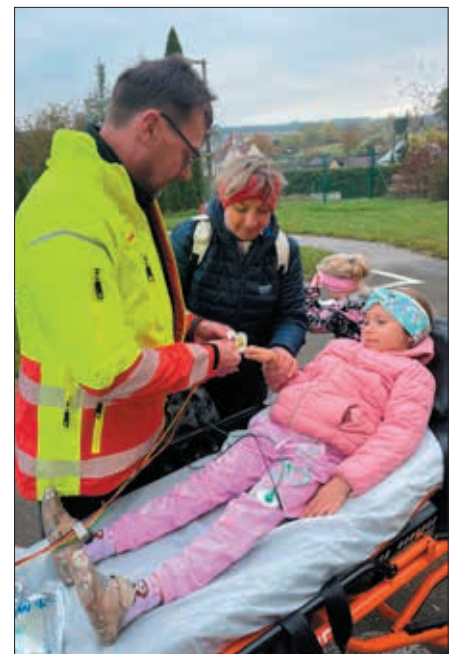
Učíme se první pomoc