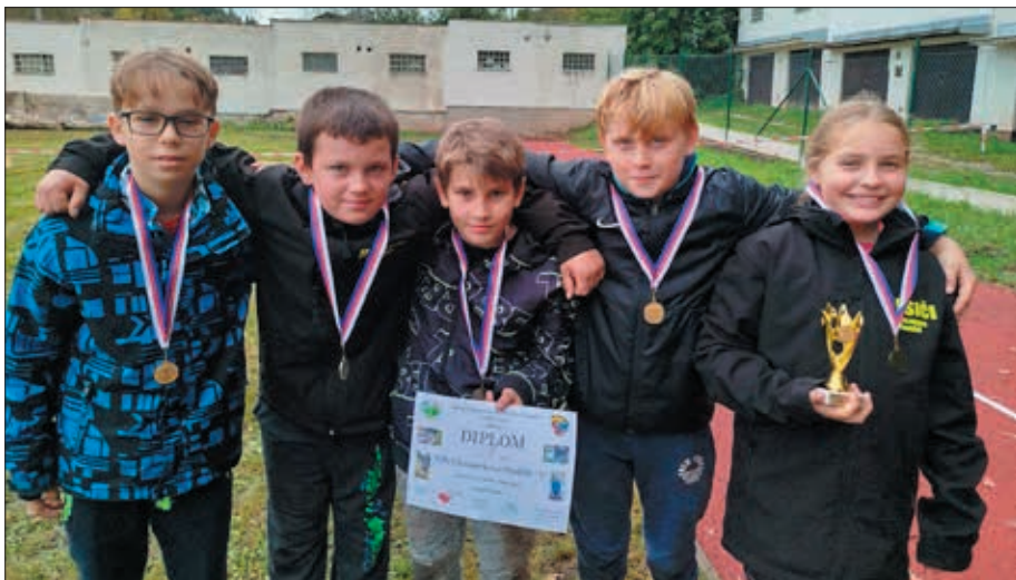
Mladší jako vítězové okresního kola ZHVB

MČR nám utekl o necelou minutu, takže jsme měli za cíl nenasbírat žádné zbytečné trestné body po trati. Dorostencům se opravdu dařilo, trestný bod žádný, běh velmi pěkný, čekání na výsledky nekonečné, ty byly ale nejlepší, první místo a v dubnu se budeme účastnit MČR. Mladším se bohužel tak nedařilo, přehlédli fáborčky na trati a vynechali jedno stanoviště, což zna-