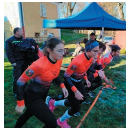
Dorost vybíhá pro své vítězství v krajském kole ZHVB

Úsměv jsme neztratili ani další sobotu na Závodu hasičské všestrannosti a brannosti, který se konal v Hostinném. Na start se postavila hlídka