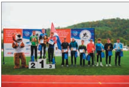
MČR – Vojtěch 9. místo

Průběžně se naše hlídky mladších a dorostenců připravovaly na krajské kolo ZHVB, které se konalo v Bílých Poličanech. Dorostenci se krajského kola zúčastnili již vloni, postup na