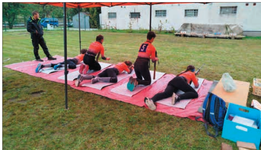
Dorost na ZHVB – stanoviště střelba