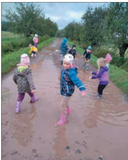
Děkujem za holínky

Další informace a aktuality si můžete přečíst na našem webu na adrese https://www.mschoustnikovohradište.cz/ , na fotografie se můžete podívat v naší fotogalerii na www.rajce.idnes.cz .